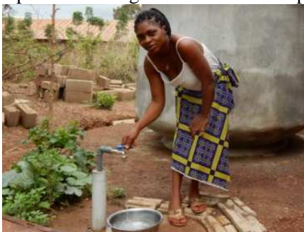
kraan op afstand, ook binnen, extra gemak

Op onze centra gaan we door met experimenteren met gebruiksvriendelijkheid, vorm en capaciteit.