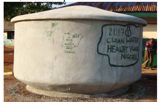
15.000 l bij een school