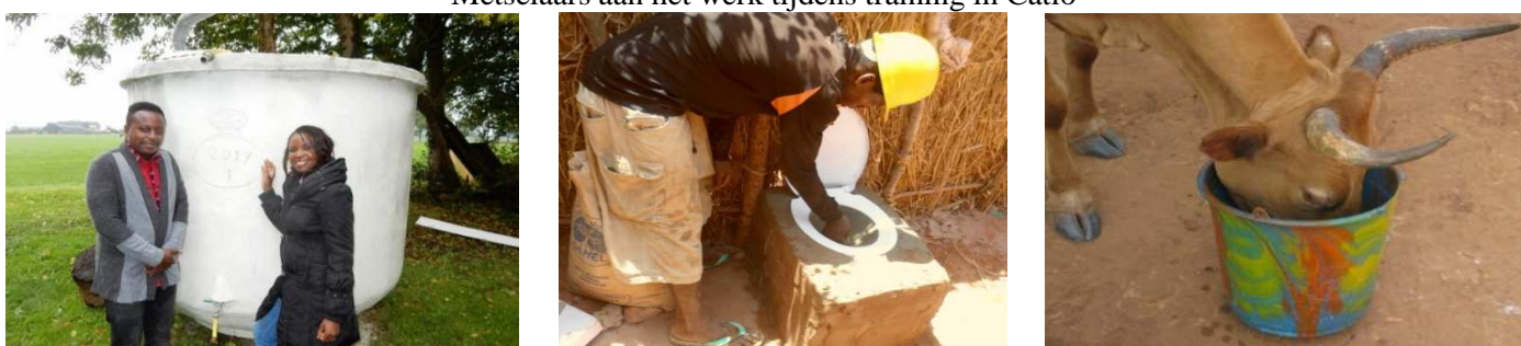
Kenianen bij tank in Nederland