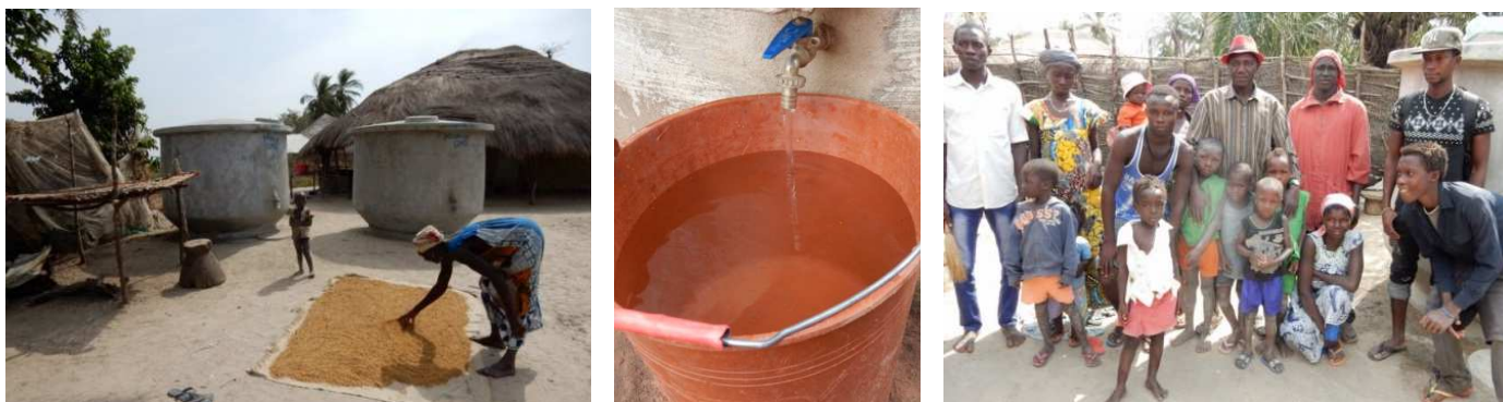
Polon de Sinsa in Guinee-Bissau, een gezond dorp van rijstboeren met voldoende drinkwater