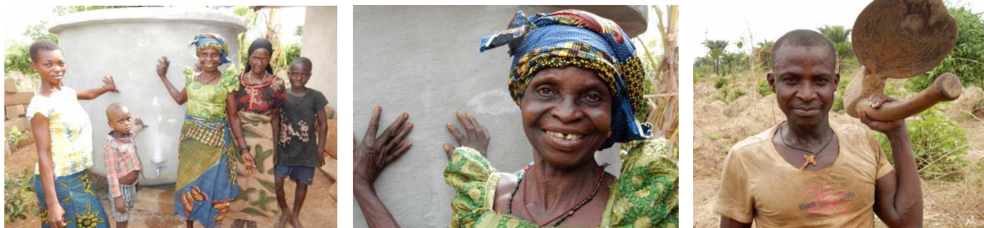
boerenfamilie met calabash tank in Nigeria