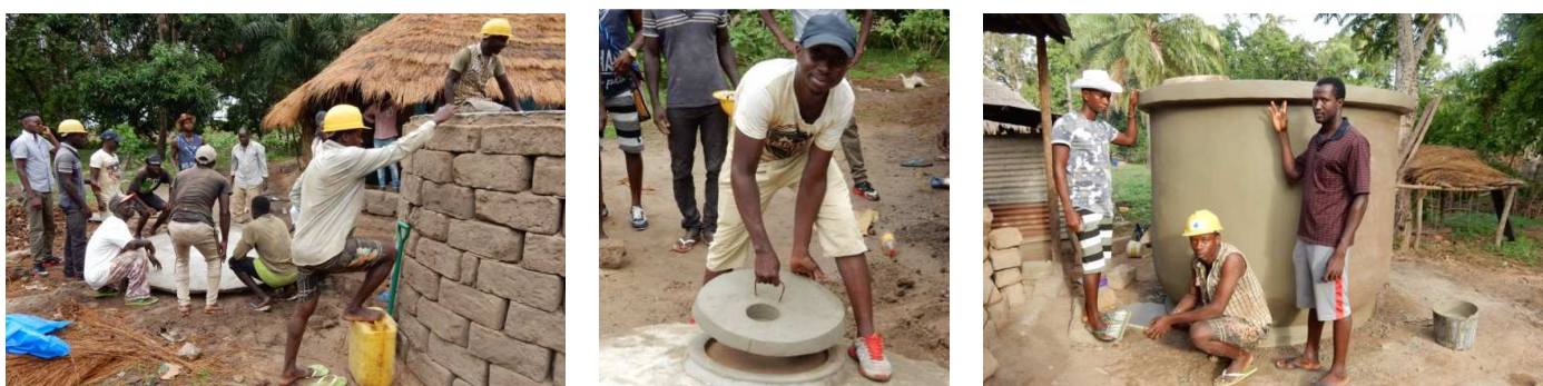
Metselaars aan het werk tijdens training in Catio