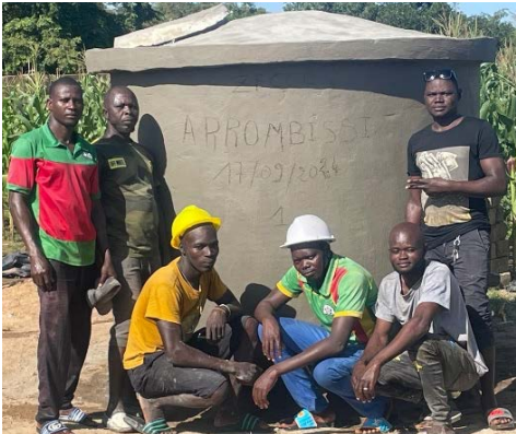
Conflictgebied Burkina Faso