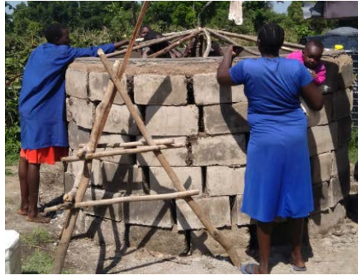
Training van vrouwen voor self-help