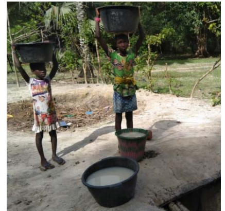
deze meisjes: geen tijd voor school

Empowering: Training voor 7 Vrouwen van de Selfhelp Group in Emburkutia, Kenia, 30 mei – 5 juni 2024.