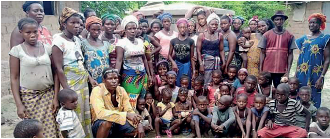
De bevolking van Canifaque blijft op het eiland wonen dankzij hun Calabash Cisternen. Canifaque telt 1130 bewoners, 98 keukens en 134 Calabash Cisternen.