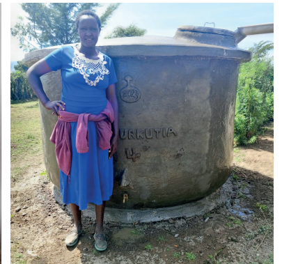
Emburkutia women self help, Kenia 2023

Perspectief: Als bestuur denken we dat we op een goed spoor zitten. Continuïteit staat nu voorop! De projecten in Afrika volgen hun eigen tempo, soms snel, soms stagnatie. We onderhouden contact via ons netwerk, zorgen voor uitwisselen van gegevens en technieken, bevorderen trainingen. In Nederland vinden we samenwerking met collega organisaties, zoals: Ghana Over de IJssel, CBR Effata, Hart en Handen Congo, St. Drinkwater Kameroen. Met de Calabash hebben we RWH toepasbaar gemaakt op basis niveau, "grassroot". We hopen dat ook grotere organisaties onze Calabash Cisterne overnemen. Dat lukt bijvoorbeeld in DRC met Vision Mondiale, met Wellfound en Lanka RWH Forum, Tatirano in Madagascar. Isla Urbana in Mexico, etc.